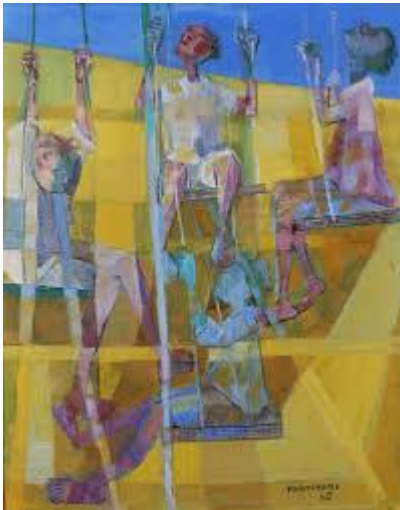
Meninos no balanço, 1960