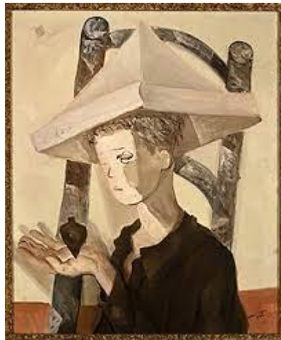
Menino com pião, 1947