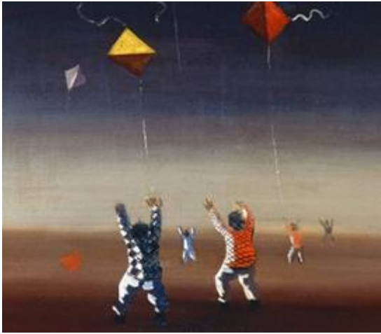
Meninos soltando pipas, 1947