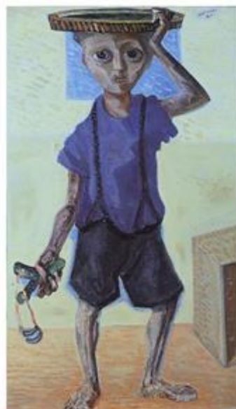
Menino com estilingue, 1947