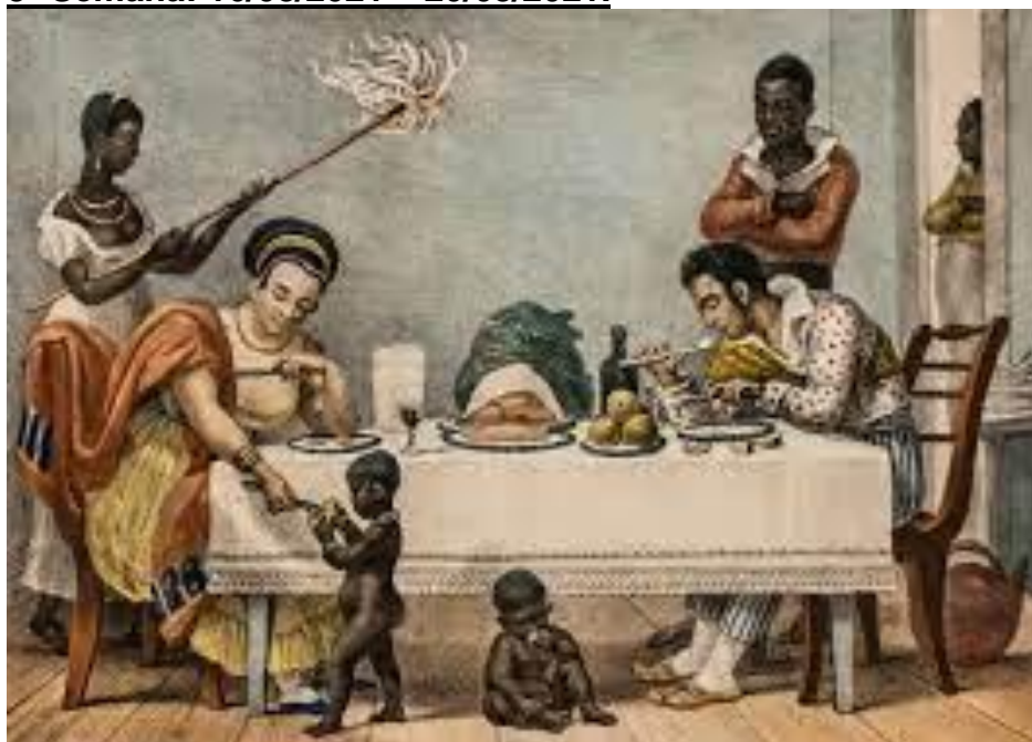
Imagem representando a pintura " Um jantar brasileiro " (1827) de Jean-Baptiste Debret .