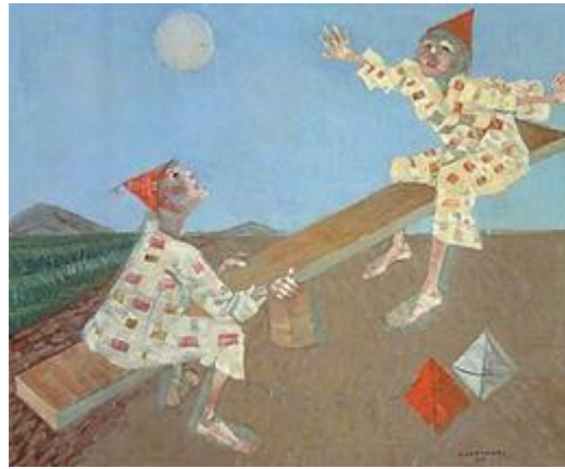
Palhacinhos na gangorra, 1957