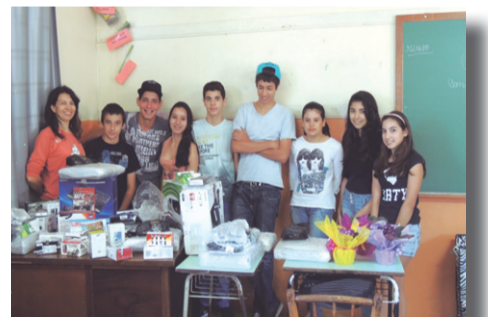
Estudantes da EMEF Nossa Senhora do Perpétuo Socorro escreveram uma cartinha ao PMEF.

“Nós gostaríamos de homenagear a equipe do Programa de Educação Fiscal pelo maravilhoso trabalho que vem realizando durante esses 7 anos do Cid Legal Canta e Dança. Ao aprendermos sobre tributos e participarmos do festival aprendemos a importância de ser um cidadão completo ao nos integrarmos com todas as escolas participantes do programa.