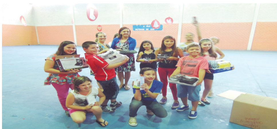
EMEF Altina Teixeira