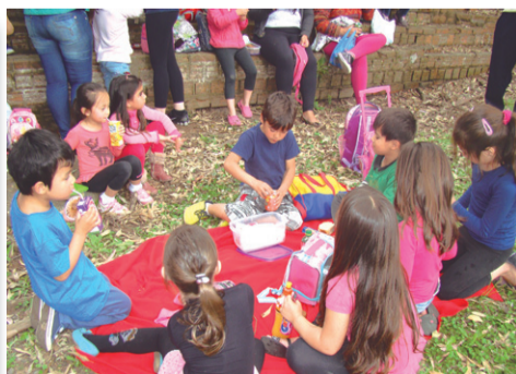
Hora do Lanche: Picnic realizado com os pequenos.