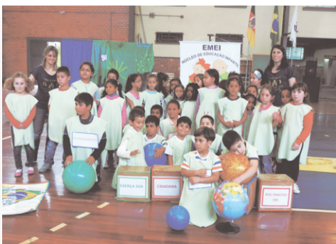
Educação Infantil CAIC Luizinho de Grandi Apresentação : O mundo é uma bola