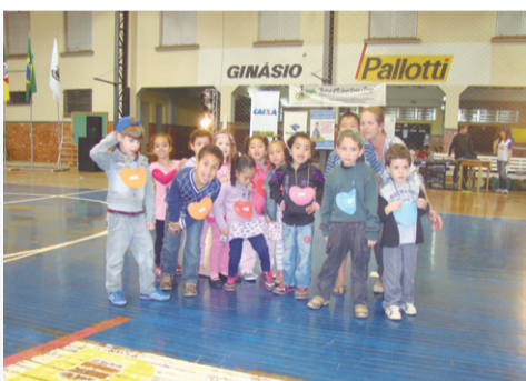
EMEI Eufrásia Pengo Lorenzi Apresentação : Remexe