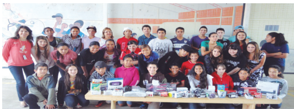
EMEF Júlio do Canto

São mais de 600 estudantes premiados de 23 escolas que participaram dos festivais, entre os prêmios estão eletrônicos como vídeos-game, celulares, tablets e câmara digitais sorteados para os estudantes.