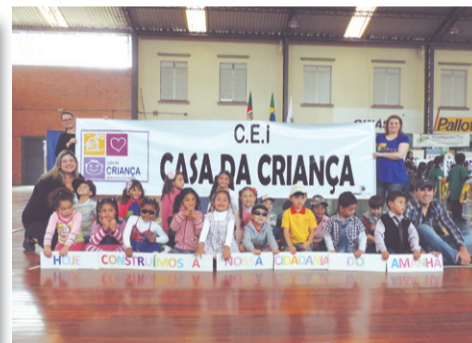
EMEI Casa da Criança Apresentação : Pequeno Cidadão