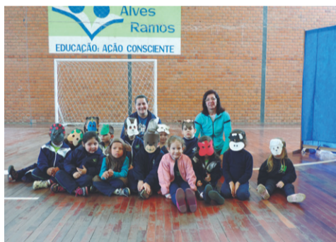
Colégio Antônio Alves Ramos Apresentação: Teatro