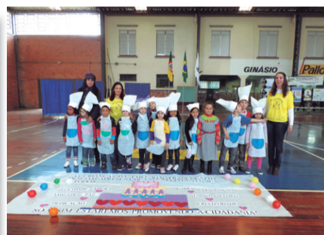
EMEI João Franciscato Apresentação : Receita Mágica