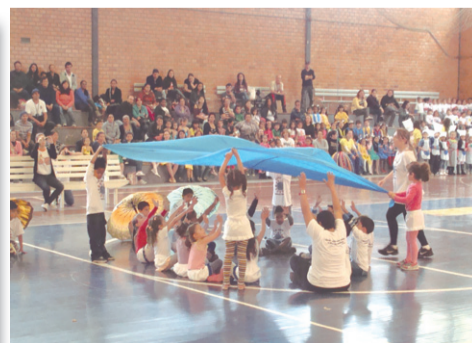
O plateia do evento formada por alunos, pais e professores se divertiu com as apresentações.