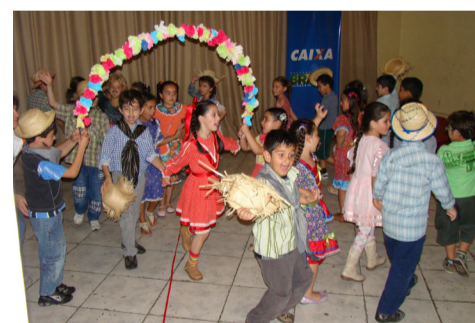
EMEF Coronel Pillar fez a festa no palco com a música "Festa no Arraiá"

A EMEI Montanha Russa tem uma caminhada junto ao Programa Municipal de Educação Fiscal. No decorrer desse percurso, as crianças trabalham com assunto de gente grande e, principalmente, mostram a todos nos como desejam que o mundo seja deixado para eles.