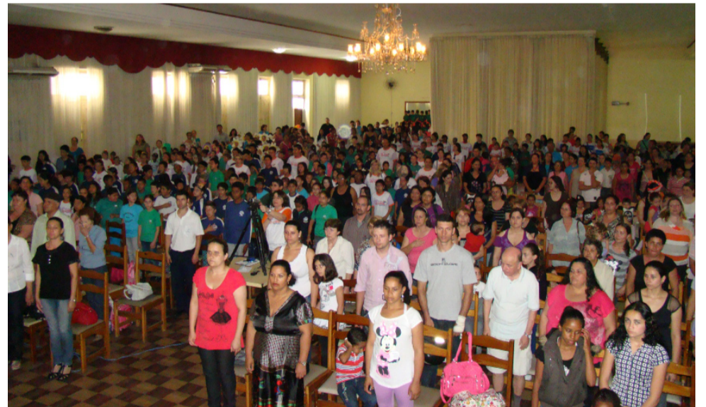
O Público lotou o Clube Caixeiral para assistir a mais uma etapa do 5º Festival Cid Legal Canta e Dança

Apresentação da paródia "A NOTA" pelos professores da EMEF Pão dos Pobres Santo Antônio que incentiva a busca pelo conhecimento, para que haja o crescimento pessoal e a integração com o pequeno e grande grupo, possibilitando o exercício da cidadania. Os professores também ensinam através do exemplo.