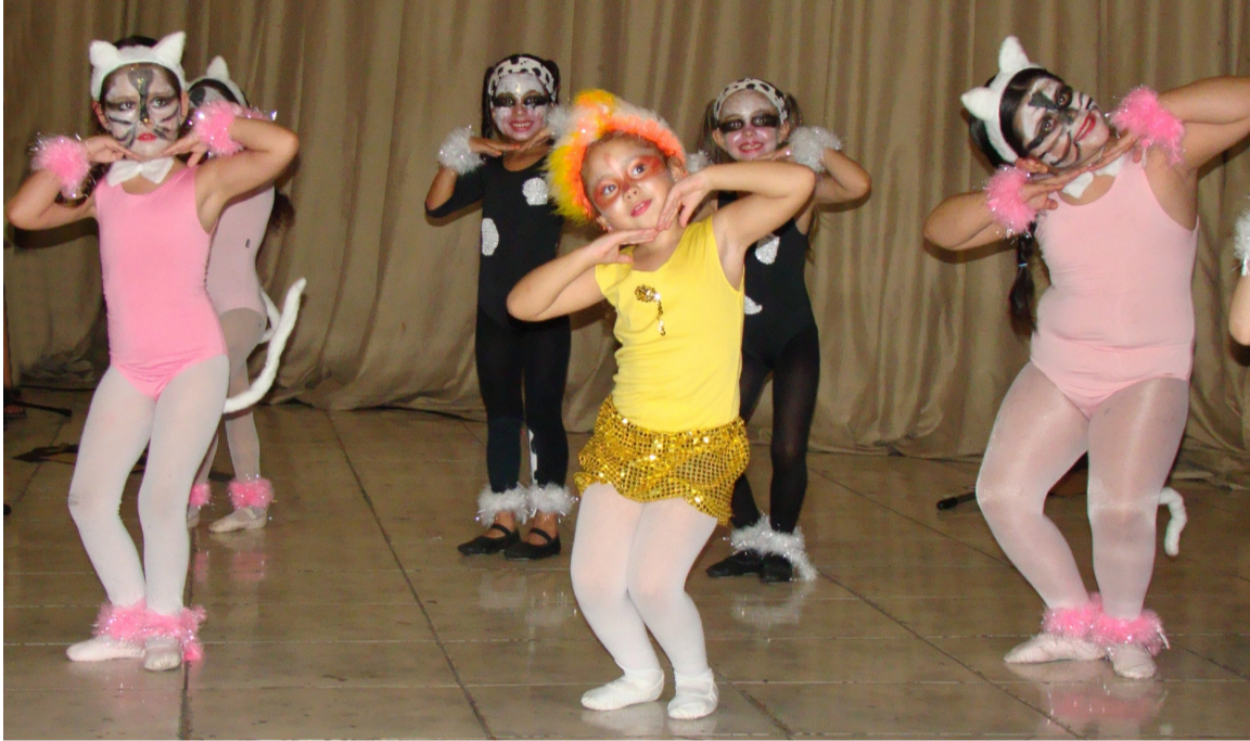
EMEI Casa da Criança - A cidade legal

Alegria e Cidadania. Evento movimentou mais de 5 mil participantes