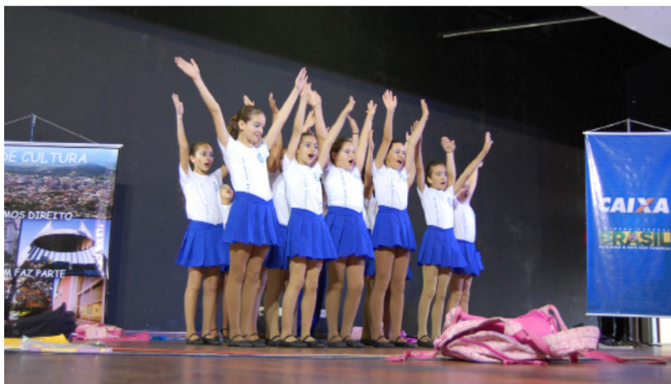
EMEF Nossa Senhora do Perpétuo Socorro mostrou, em uniforme muita alegria