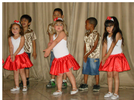
Graça e harmnia na apresentação da EMEI Ida Fiori Druck