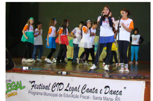
EMEF Pinheiro Machado cantou e levantou o público