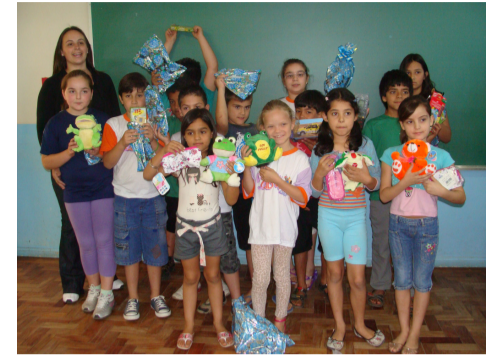
EMEF Lívia Menna Barreto