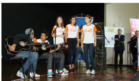
EMEF Don Antônio Reis mostrou ritmo na paródia que apresentou

Com essa conscientização Deixo a minha opinião Peça sua nota E que lhe sirva de lição.