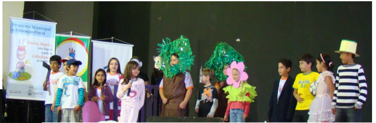
EMEF Livia Menna Barreto apresentou uma coreografia que encantou a plateia

Consórcio SIM (Sistema Integrado Municipal) transportou gratuitamente as 33 escolas para o festival.