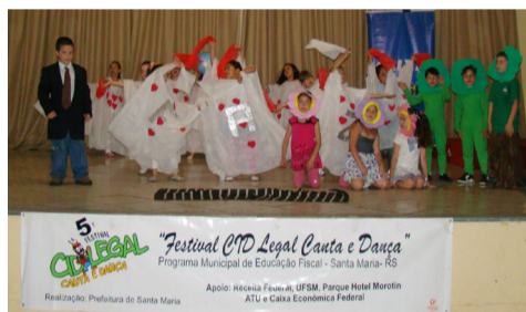
EMEF Duque de Caxias apresentou com criatividade e desenvoltura