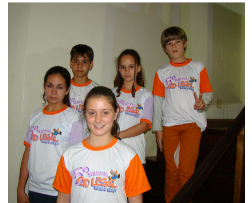
Os alunos da EMEF Livia Menna Barreto apresentaram lindas poesias

escolas participantes e mais de 5 mil pessoas. O PMEF conta com a parceria da Receita Federal do Brasil, Receita Estadual, 8ª Coordenadoria Regional de Educação, Câmara Municipal de Vereadores, Universidade Federal de Santa Maria e o patrocínio da Sociedade Vicente Pallotti e da Caixa Econômica Federal, que disponibilizaram 580 camisetas para os participantes e comissão organizadora do Festival. A Receita Federal do Brasil destinou mercadorias apreendidas para serem distribuídas como