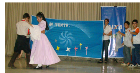
Apresentação impecável da EMEF Pedro Kunz