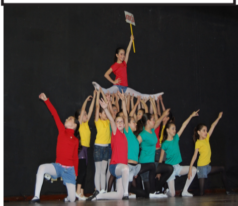
Colégio Antonio Alves Ramos mostrou uma coreografia impecável na primeira tarde do encontro

A cidadania começa na família./ Continua na escola e completa-se/Na participação social e coletiva/Em comunidade. //Ser cidadão, é exigir do vencedor/Ou prestadores de serviço/A nota fiscal./É exigir do governo,/ Uma administração dos recursos/Recolhidos visando o bem comum.