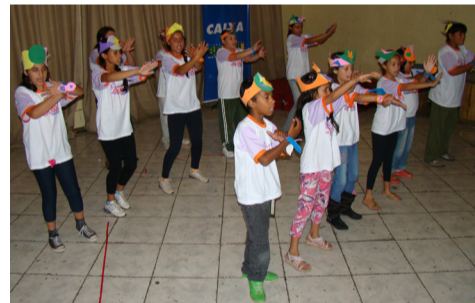
EMEF Renato Nocchi Zimmermann dançou ao som de Luan Santana com a música a Bússula