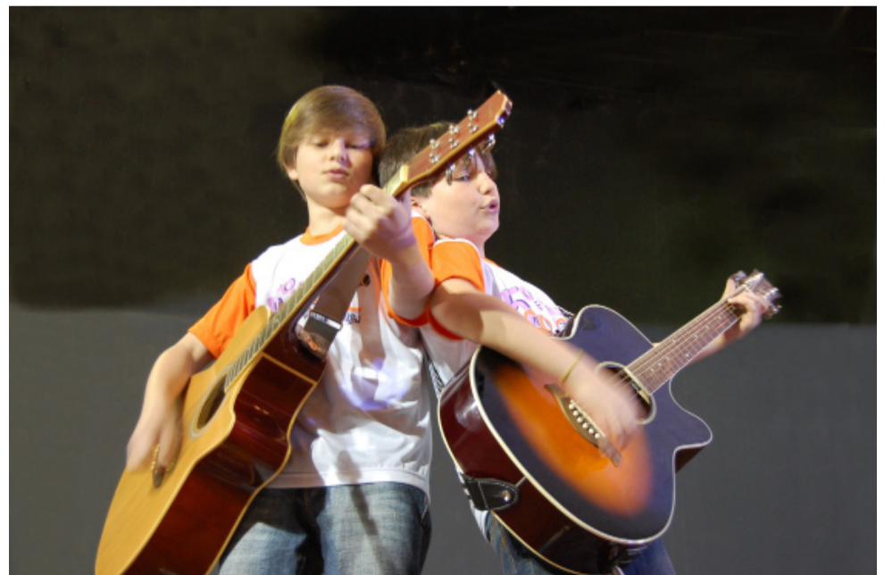
Os alunos da escola EE General Edson Figueiredo levantaram o público com a paródia "Quero uma luta justa"