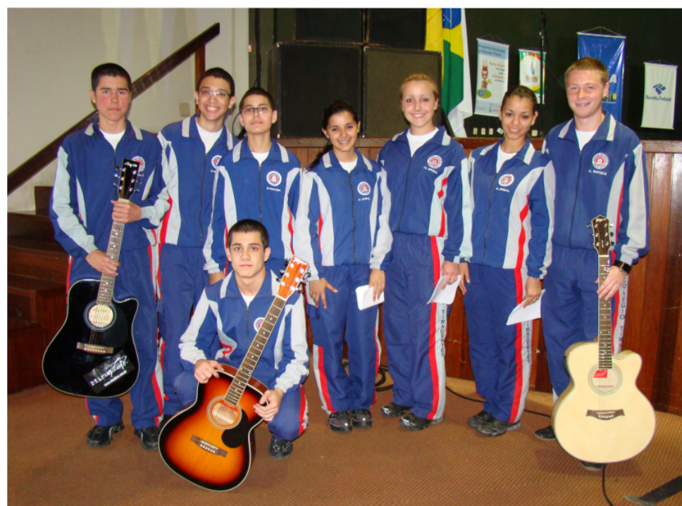
Os alunos do Colégio Tiradentes da Brigada Militar de Santa Maria deram um show na interpretação, tocando e cantando, da paródia 'Cobro noite e dia'.