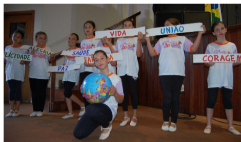
Os alunos da Escola Estadual de Ensino Fundamental junto ao Caic Luizinho de Grandi apresentaram uma coreografia engajada nas questões de preservação ambiental.