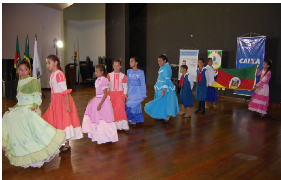
Com uma dança tradicional gaúcha, os alunos da Escola Estadual de Ensino Fundamental Almiro Beltrame prenderam a atenção da plateia

EE ALMIRO BELTRAME Categoria: Dança Música: Herdeiro da pampa pobre "A música escolhida foi perfeita, e com criatividade realizaram uma bela apresentação." Neimar Iop