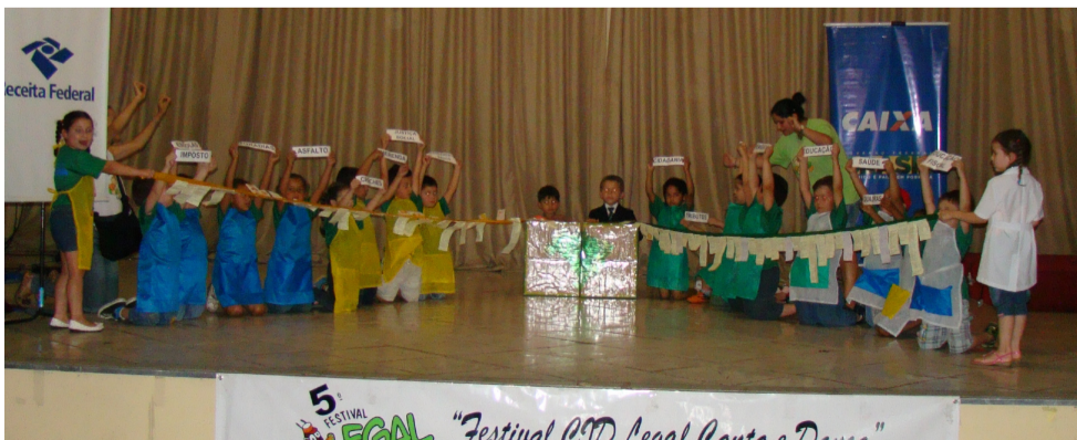
Núcleo de Educação Infantil CAIC Luizinho De Grandi