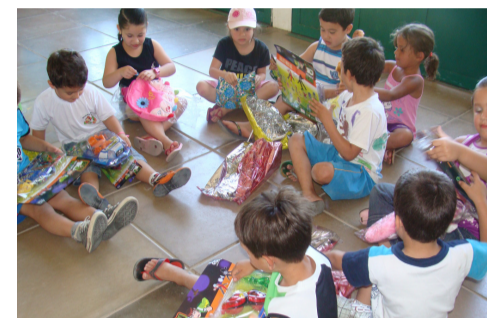
Núcleo de Educação Infantil CAIC Luizinho De Grandi

essas crianças deram durante o festival”, comentou a diretora. Os brinquedos foram uma destinação da Receita Federal do Brasil. Todos os alunos que