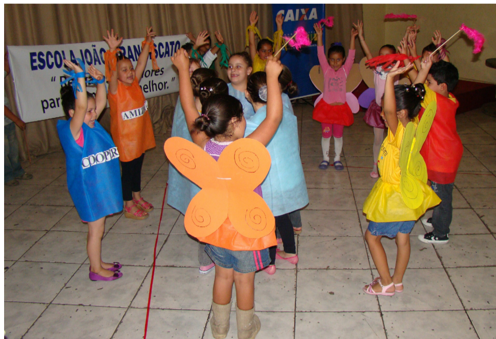
EMEI João Franciscato encantou a plateia com a dança acompanhada da música Arco-íris

O tema educação fiscal norteou as apresentações e foi relacionado a assuntos como o meio ambiente, natureza, política e justiça social. De forma criativa e original, as crianças e adolescentes inovaram nas fantasias, aperfeiçoaram os passos e reafirmaram o sucesso de mais esta edição do Festival.