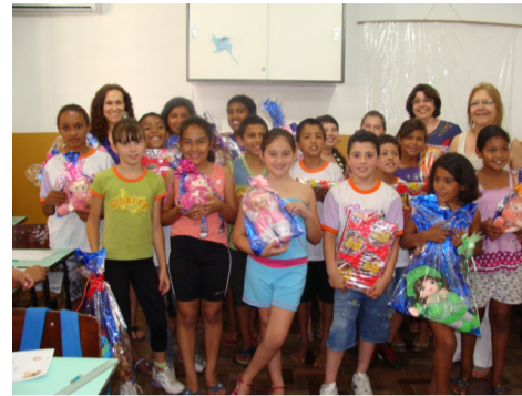
EMEF Júlio do Canto

Difícil mesmo foi controlar a agitação dos estudantes e voltar à aula depois da entrega dos mimos. “Nada mais justo, depois da aula de conscientização que