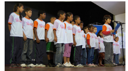
EMEF Diácono João Luiz Pozzobon levou alunos que apresentaram a paródia "Como Aprendi"

Ô, ô lá em casa! É que a gente começa a pensar em mudar Ô, lá em casa! Nas pequenas coisas, vamos melhorar.