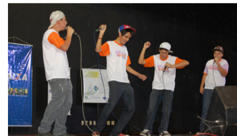
Meninos do Instituto São José cantaram, em versão sertaneja, a paródia 'Sem Nota' e alegraram o público com os passos de dança.