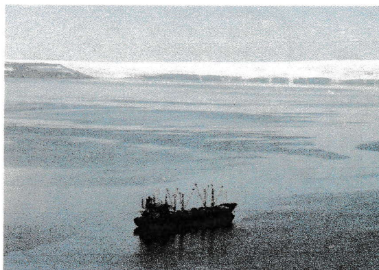
Navio de pesca de krill , Half Moon Bay, Estados Unidos, 2018.

Era verão na Antártida. “A temperatura média estava agradável, entre zero e 5 °C negativos”, conta Amyr Klink.